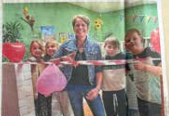
1. Kinderen worden enthousiast bij de opening van de Dalton schoolbibliotheek.