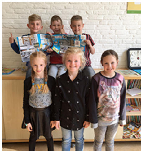
Deze leerlingen maakten de winnende collage