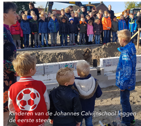
Kinderen van de Johannes Calvijnschool leggen de eerste steen

een prachtig gebouw met nieuw meubilair wat aansluit op ons onderwijs en met een nieuwe naam. Samen hart voor de kinderen, samen hart voor Nijkerkerveen.